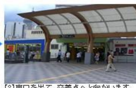
【2】東口を出て、交差点へと向かいます。