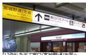
【1】改札を出て東口(宮城野道)方面へ。