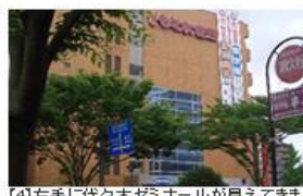
【4】左手に代々木ゼミナールが見えてきます。