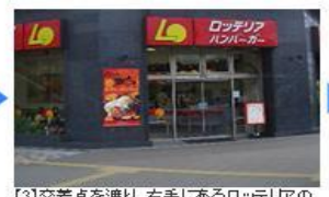
【3】交差点を渡り、右手にあるロッテリアの前を通り過ぎます。