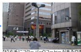
【5】右手にスターバックスコーヒーがある交差点を右に曲がります。