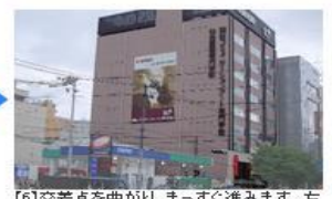
【6】交差点を曲がり、まっすぐ進みます。左手に校舎が見えてきます。